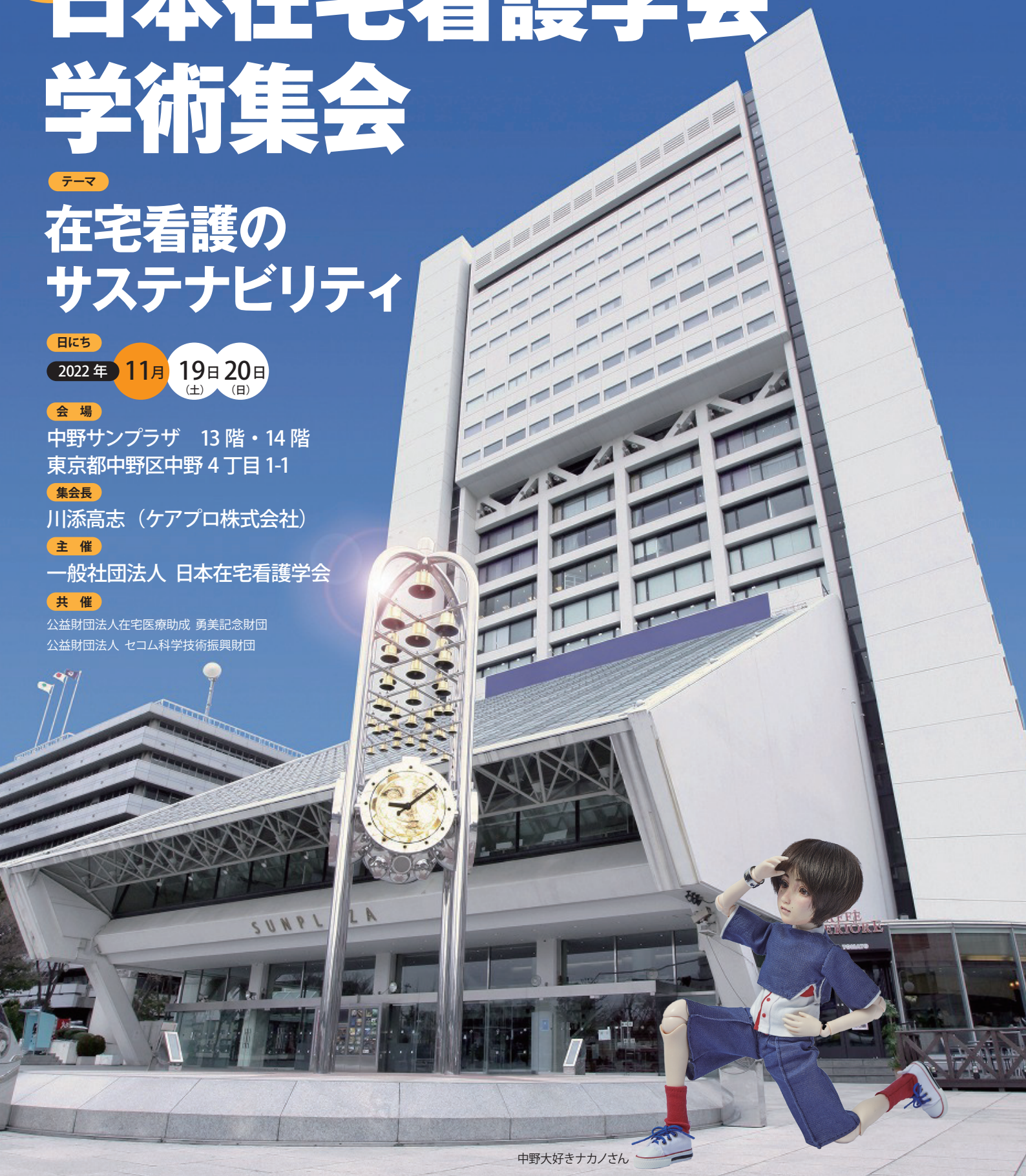
中野大好きナカノさん